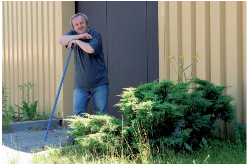
Jeden z pracowników Spółdzielni Socjalnej „Nowy Horyzont”

W 2004 roku miasto przekazało stowarzyszeniu w nieodpłatne użytkowanie na czas nieokreślony zdewastowane hale fabryczne po zakładach „Polifarb”. Jedna z hal pełniła początkowo funkcję magazynu na używany sprzęt RTV i AGD oraz na ubrania i żywność dla najuboższych mieszkańców Cieszyna, inne hale stały