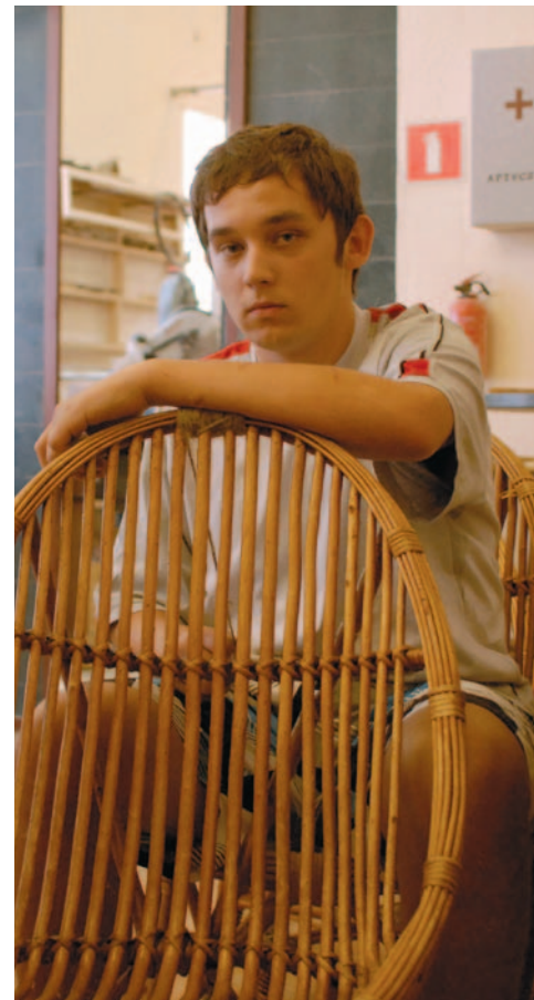
Uczestnik warsztatów edukacyjnych

Centrum Edukacji Socjalnej, w ramach którego działają Domy Wspólnoty jest wewnętrzną jednostką stowarzyszenia prowadzącą działalność gospodarczą.