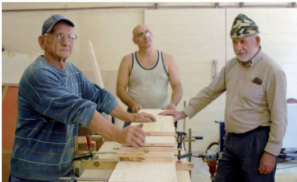
Mieszkańcy domów podczas pracy w stolarni