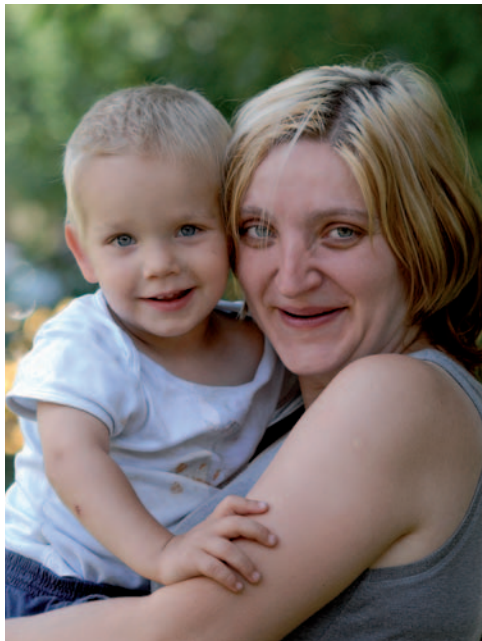
Dom Matki i Dziecka „Słonecznik”

uzależnienia. Potem odbywa się publiczne głosowanie. Jeśli ktoś jest alkoholikiem – a tak jest najczęściej – zostaje przyjęty na jedno-, dwutygodniowy okres interwencyjny. W tym czasie musi załatwić swoje sprawy: zapisać się do poradni leczenia uzależnień, zrobić badania lekarskie, zarejestrować w urzędzie pracy. Po zakończeniu leczenia – na kolejnym spotkaniu mieszkańców – kandydat zostaje przyjęty na miesięczny okres próbny, podczas którego uczęszcza na warsztaty. W tym czasie przygotowuje się do życia we wspólnocie, do zmiany sposobu myślenia.