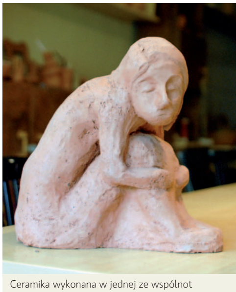
Ceramika wykonana w jednej ze wspólnot

Poza nadzorowaniem funkcjonowania Domów Wspólnoty CES prowadzi wiele innych działań i projektów związanych z tematyką bezdomności.