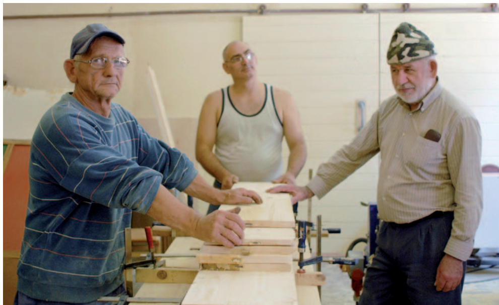
Mieszkańcy domów podczas pracy w stolarni