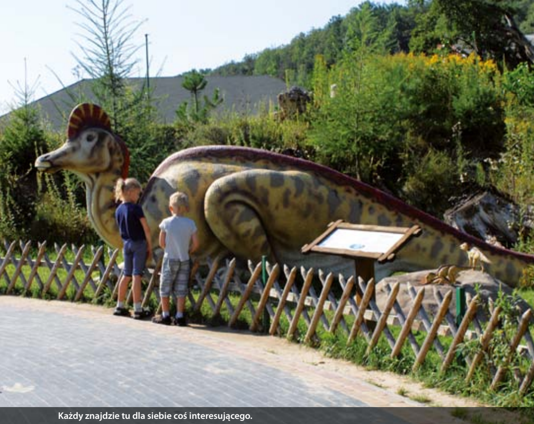
Każdy znajdzie tu dla siebie coś interesującego.

dzieci. Było bardzo ciężko. Wszyscy uciekali do Warszawy, moi dwaj bracia także wyjechali. Ludzie nie mieli nadziei, zamykali się w domach przed innymi. Teraz nikt by Bałtowa nie poznał – czyściutko, porządek w każdej posesji, prawie każdy z Bałtowa ma pracę. Pracujemy nie tylko dla siebie, jak kiedyś, ale też dla innych. Zyskałiśmy nadzieję, już nie musimy prosić się o zasiłki, znamy swoją wartość. Ludzie coraz powszechniej zaczynają działalność gospodarczą – w mojej wsi jest garncarz, który uczy dzieci swojej sztuki, są tacy, co robią dinozaury z szyszek, bo u nas dinozaury są wszędzie! Stowarzyszenie „Bałt” umożliwi