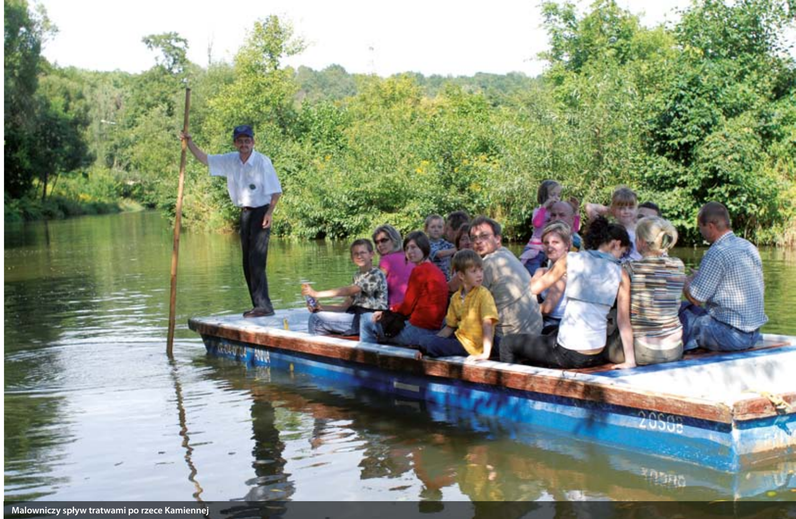
Malowniczy spływ tratwami po rzece Kamiennej

W realizację projektu rozwoju Bałtowa angażują się różnorodne grupy