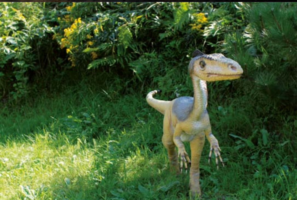
– No i co by tutaj „zmajstrować”? – zastanawia się jeden z mieszkańców Bałtowskiego Parku Jurajskiego.