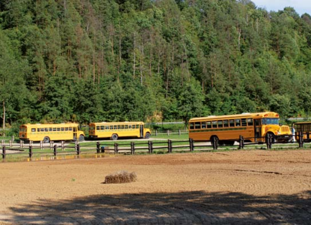
Turyści mogą zwiedzać Bałtów podróżując oryginalnymi amerykańskimi SCHOOL BUS-ami.