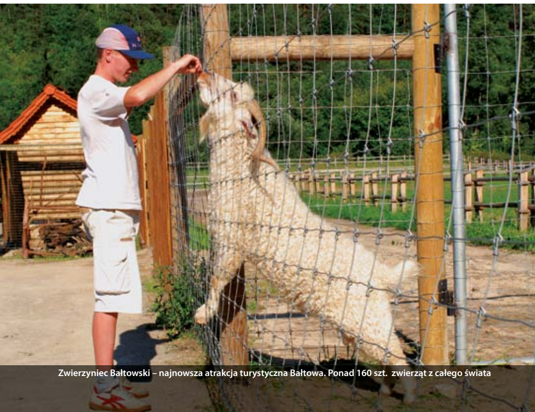
Zwierzyniec Bałtowski – największa atrakcja turystyczna Bałtowa. Ponad 160 szt. zwierząt z całego świata

Aby zrealizować kolejne przedsięwzięcie turystyczne – Park Jurajski, Zarząd Stowarzyszenia postanowił utworzyć nowy, odrębny podmiot ekonomii społecznej – Stowarzyszenie „Delta”. Chodziło o to, by „Bałt” skupił się głównie na działalności społecznej: wspieraniu zespołów ludowych, organizowaniu imprez