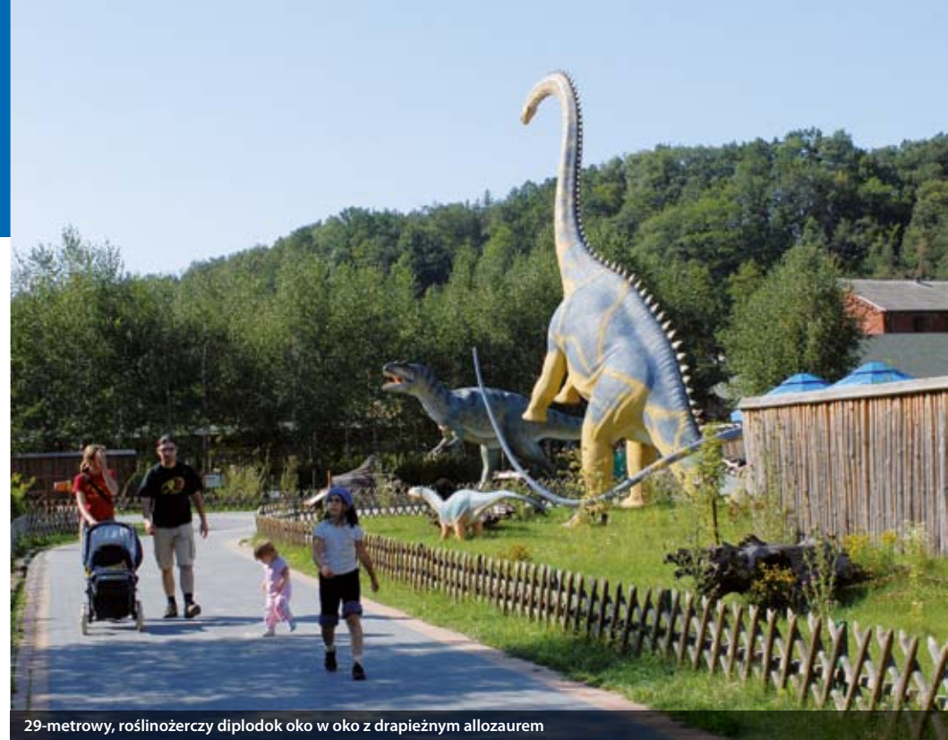
29-metrowy, roślinożerczy diplodok oko w oko z drapieżnym allozaurem

Poprzednie władze gminy niewiele w tej kwestii zrobiły – nie było kanalizacji, wodociągów, telefonii komórkowej, oczyszczalni ścieków, ani ośrodków kultury, zespołów ludowych, czy świetlic wiejskich. Władze nie były także zainteresowane