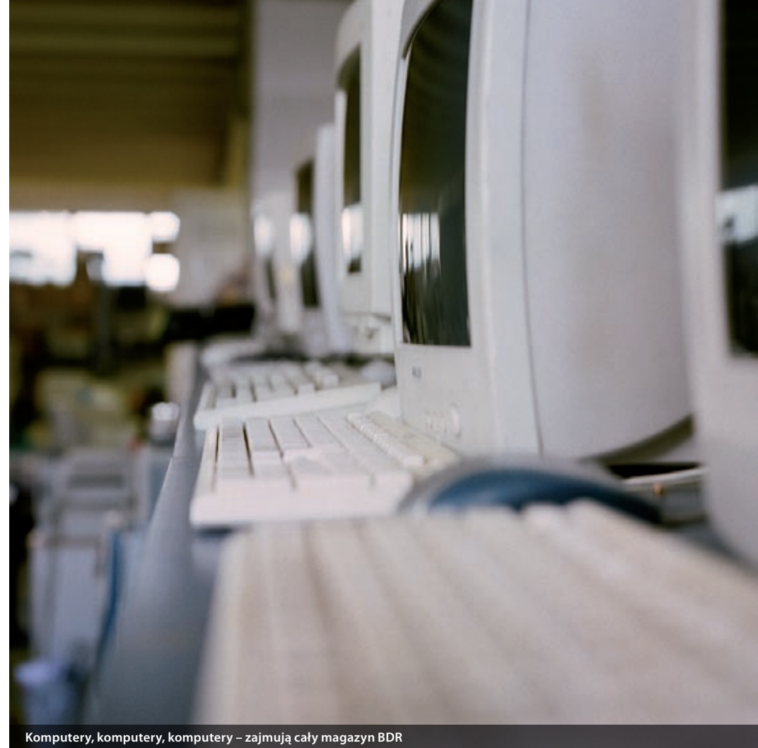
Komputery, komputery, komputery – zajmują cały magazyn BDR

Serwis powstał, aby umożliwiać osobom prywatnym przekazywanie używanych, ale wciąż sprawnych rzeczy organizacjom i placówkom non-profit z całej Pol-